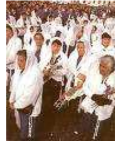
Señor de los Milagros